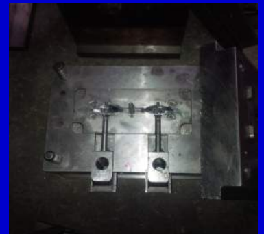
Werkzeuge aus China